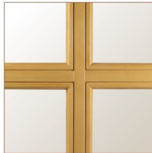
Sprosse glasteilend 66 mm (Innenansicht), auch in 78, 100 und 130 mm erhältlich

Mit Sprossen erhalten Ihre Fenster eine unverwechselbare Optik. Sprossen können bei allen Fenstertypen montiert werden. Auch im Luftzwischenraum zwischen den Gläsern. Somit bleiben die Glasflächen leicht zu reinigen.