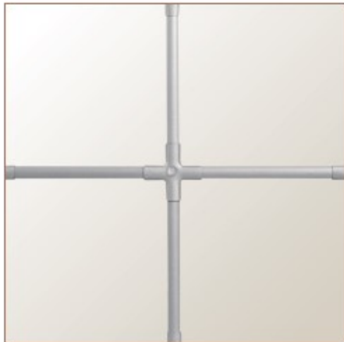
Helimasprosse 8 mm bleifarben