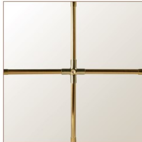
Helimasprosse 8 mm goldfarben