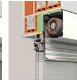
QUADRO viereckige Frontblende

Für Neubau und Renovierung RONDO, PENTO und QUADRO werden vor das Fenster montiert und eignen sich auch zur Fassadengestaltung. Es entstehen keine Wärme- oder Schallbrücken. PENTO und QUADRO werden vor das Fenster in die Laibung gesetzt und schließen flächenbündig mit der Hausfassade ab. Bei besonderen bauseitigen Anforderungen können sie auch auf der Fassade platziert werden. Alle Systeme werden auf Wunsch mit integrierten Insektenschutzgittern ausgestattet.