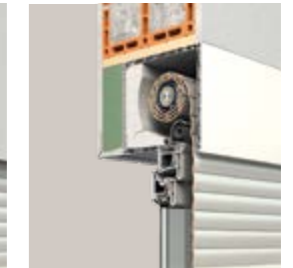
KARO mit Insektenschutz

Für Neubau und Renovierung PURO 2 ist für den Einsatz im Privat- und Objektbau bestens geeignet. Der Sicht- und Sonnenschutz bildet mit jedem Fenstertyp eine perfekte Einheit. PURO 2 ist mit integriertem Insektenschutzgitter erhältlich.