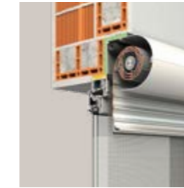
RONDO runde Frontblende