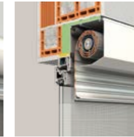
PENTO fünfeckige Frontblende